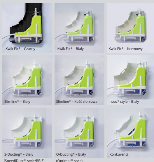
Kwik Fix* – Czarny

Satysfakcja gwarantowana. A na dodatek 3-letnia gwarancja producenta.