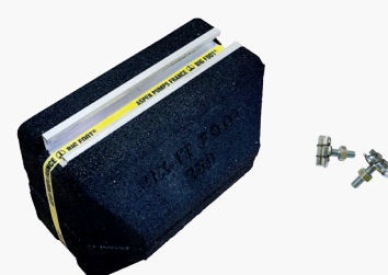
Coppia di supporti in gomma con set di viti

Informazioni corrette al momento della stampa. Non tutti i prodotti sono disponibili in tutte le regioni.