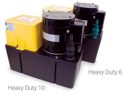
Heavy Duty 6