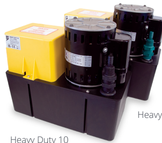
Heavy Duty 6