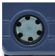
Anti-olie demister om olienevel te voorkomen