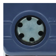
Odmgławiacz ze środkiem odłuszcającym przeciwdziałający tworzeniu się mgły