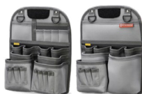
Outil avant AX3602 Mètre AX3603 Inclus