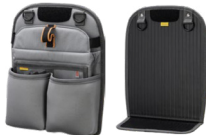
Tablette AX3604 Stockage en vrac AX3605 Vendu séparément